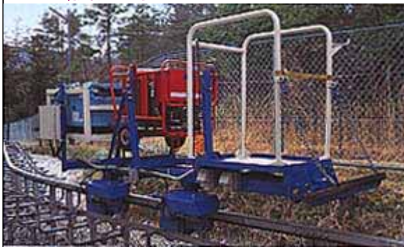
★レール敷設工事業者(EW)